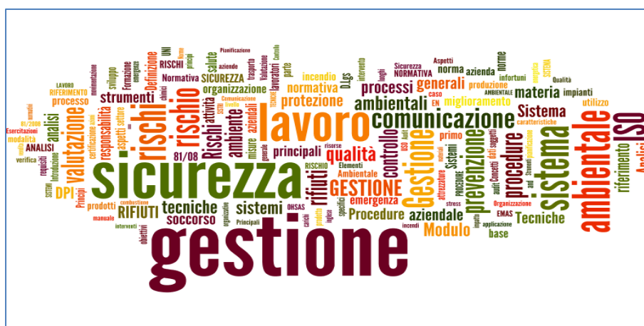
Figura 1 – Le parole dei fabbisogni formativi prevalenti nei titoli delle azioni formative del Conto di Sistema